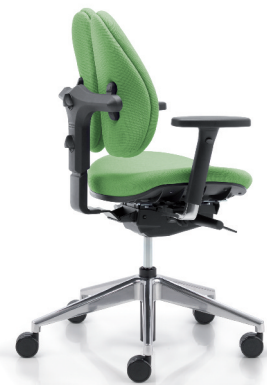
duo back® 12 | Vollpolsterrücken