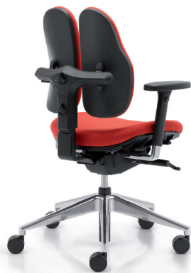
duo back® 11 | Rückenkappe in Kunststoff schwarz