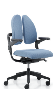
xenium-basic duo back®

Nach jedem Geschmack Wir haben das duo back® Prinzip auch in anderen Stuhlfamilien zum Einsatz gebracht.